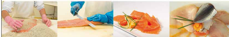
Salage à la main au sel de la Trinité sur Mer - Fumage au bois de hêtre vert du sabotier de Camors Tranchage à la main par notre équipe d'artisans